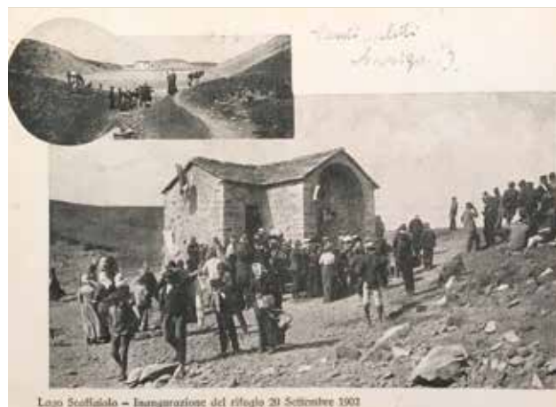
1902, inaugurazione del rifugio Duca degli Abruzzi

La sezione bolognese ricostruisce il rifugio al Lago Scaffaiolo, distrutto dalle intemperie e dal vandalismo, e lo intitola a Luigi di Savoia Duca degli Abruzzi.