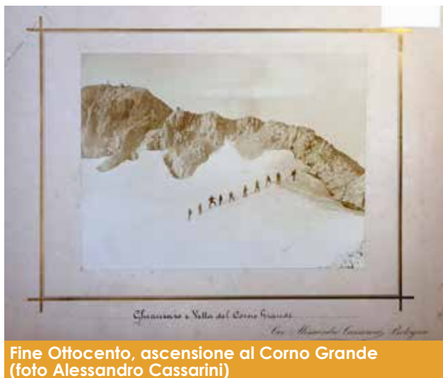
Fine Ottocento, ascensione al Corno Grande